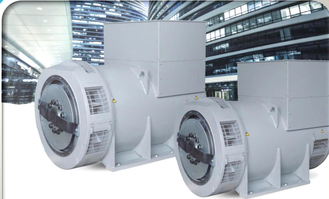
SERIES BRUSHLESS SYNCHRONOUS GENERATORS